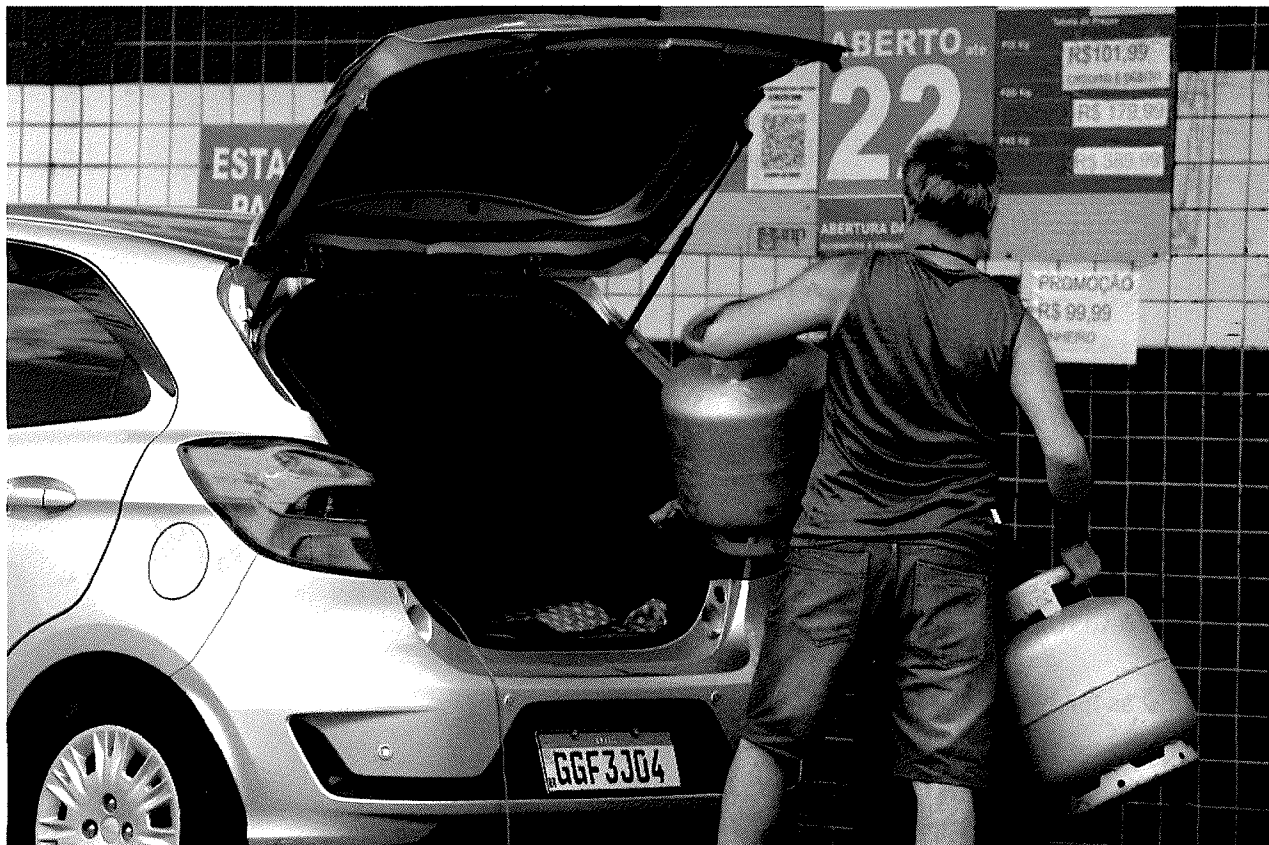
Consumidor em ponto de venda de gás em São Paulo - Rivaldo Gomes - 10.mar.2022/Folhapress

A marca equivale a um avanço de 19,5% em relação ao mesmo mês do ano passado (R$ 93,427). Em agosto de 2020, o valor era de R$ 69,981.